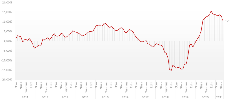
Yıllık Bazda Konut Fiyatları Reel Değişimi